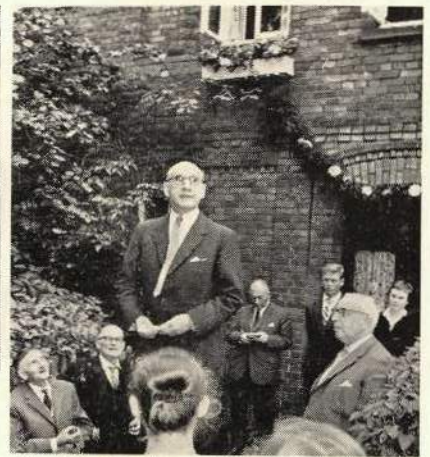
Dr. August S., Buenos Aires, hält die Festrede

43 bis 45 auszugsweise über das Wiedersehen Josephs mit seinen Brüdern aus Ägypten, mit Hinweis auf das Wiedersehen der beiden Brüder Siebrecht aus der Bornelsmühle, die sich in Amerika nach langen Jahren wiedersahen und sich nicht mehr kannten. Der Predigttext war Psalm 127, besonders Vers 3: „Siehe, Kinder sind eine Gabe des Herrn und Leibesfrucht ist ein Geschenk.“ Herr Pastor Schmidt, der schon vor 10 Jahren zu den Sippenangehörigen gesprochen hatte, hielt auch diesmal wieder eine tief angelegte Predigt, die allen Hörern zu Herzen ging. Ihm sei dafür an dieser Stelle nochmals herzlichst gedankt. Das Lied „Jesu geh voran“ beendete den Gottesdienst.