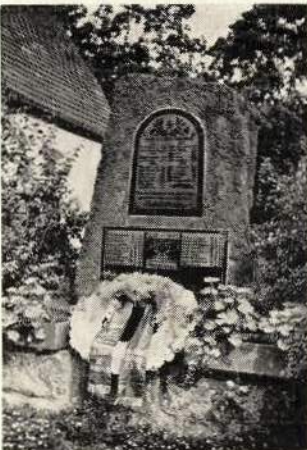
Ehrenmal in Meinbrexen