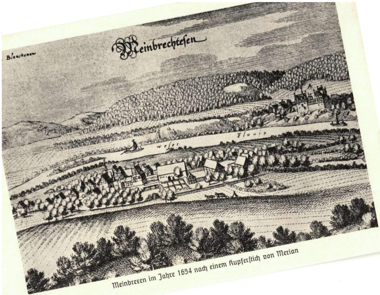
Weinbretzen im Jahre 1654 nach einem Kupferstich von Merian