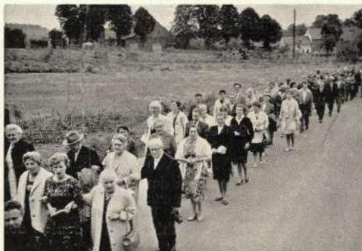
Festzug der Sippe zum Stammhaus