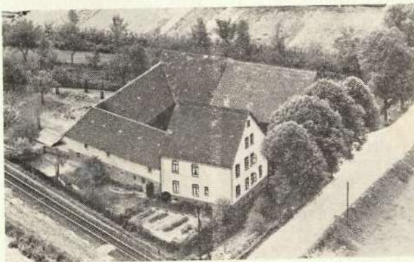
Hof Wilhelm Siebrecht-Meinbrexen

Vor 1945 war er Mitglied des Gemeinderates und auch als Ortsbauernführer tätig.